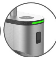
Lector RFID Lector QR