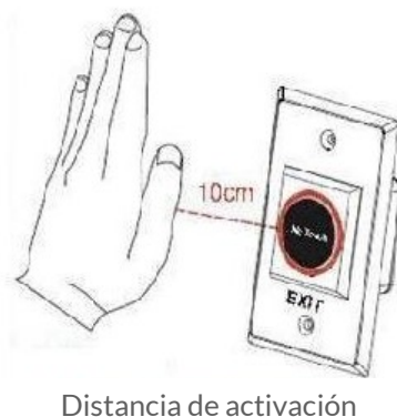
Distancia de activación