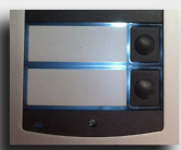
Versiones de 1 a 4 teclas